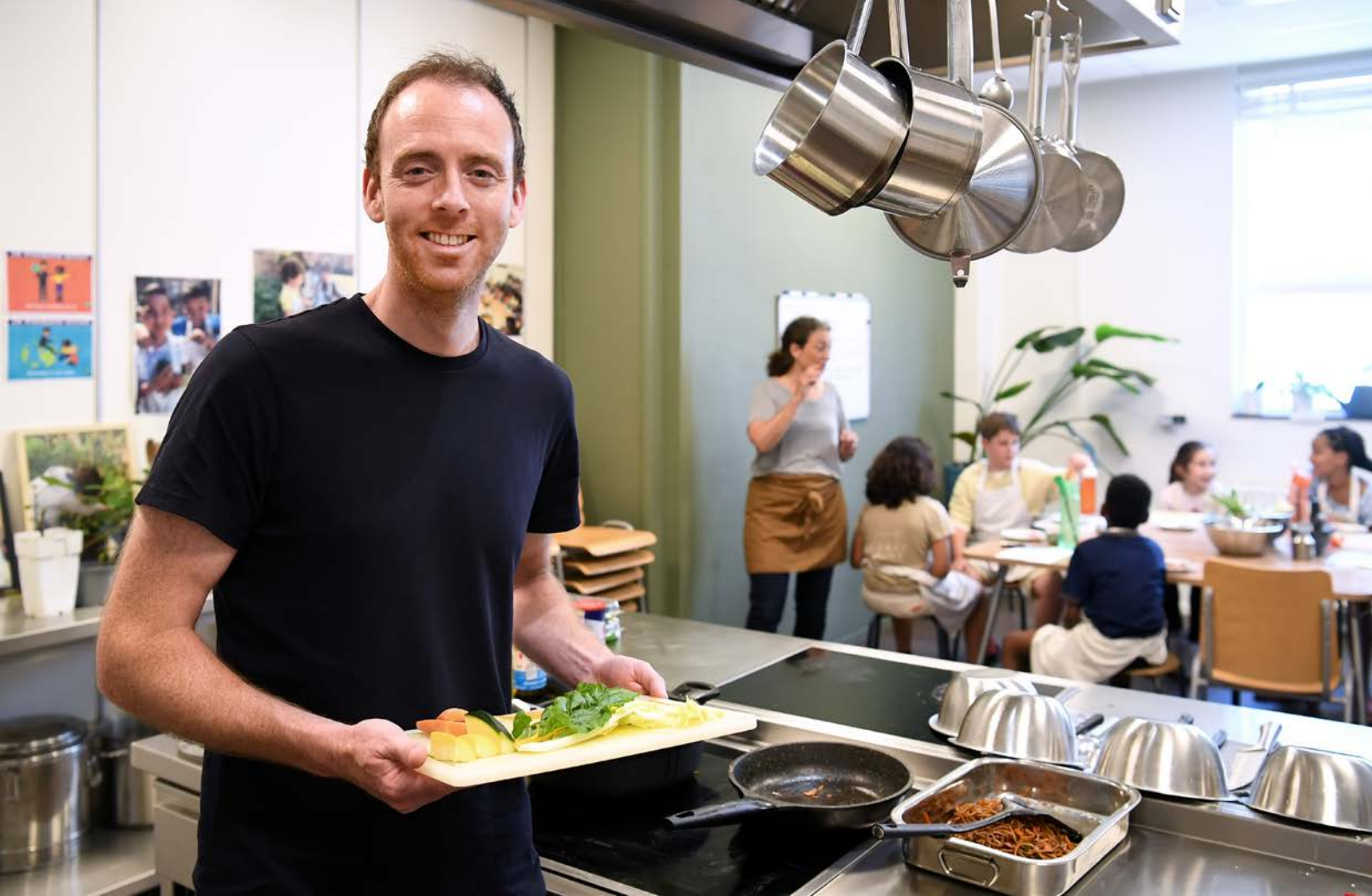
Een impressie van de 'Ouders ontmoeten Ouders' bijeenkomsten op de Indische Buurtschool